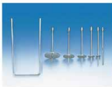
H型转子组合+保护手