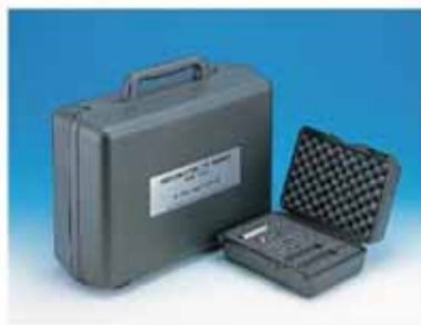
主机收纳箱+转子收纳箱