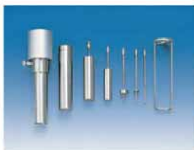
M型转子组合+BL低粘度适配器+保护手