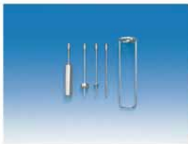
M型转子组合+保护手